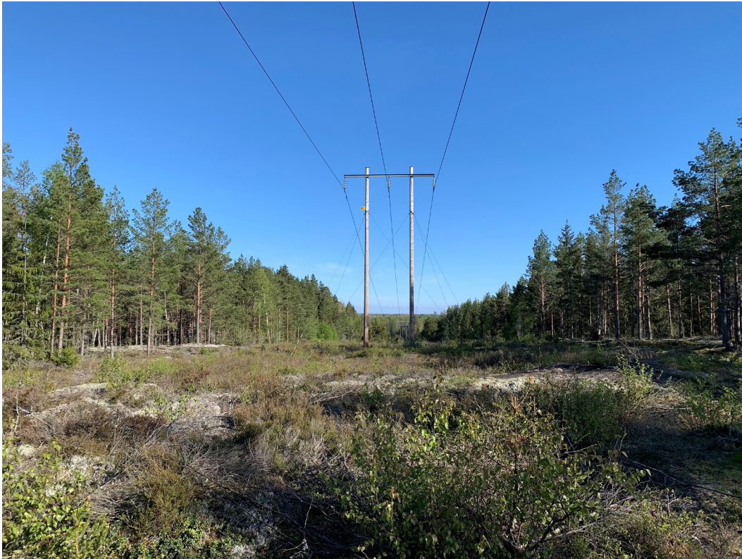
Bilden visar en 130 kV ledning i skogslandskap. Stolpen är en så kallad "portalstolpe" i trä

Informationen i denna broschyr vänder sig till dig som är berörd fastighetsägare eller närboende till en planerad kraftledning som kräver tillstånd (linjekoncession)